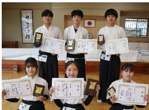
男女総合の部入賞者 中央1位・左2位・右3位