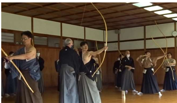
指導者・受講生ともに真剣な眼差しで

コンプライアンスについて、ハラスメントの防止について、自然・環境保護憲章についての説明や教育現場での声などの座学、また、各種様々な射礼の研修もあり、非常に有意義な内容であったと思います。30名中20名が教士受有者で、その内12名が七段というあまり見られない顔ぶれ、中には息がぴったり合って高い弦音・鋭い矢勢で皆中する射礼の立ちもありました。