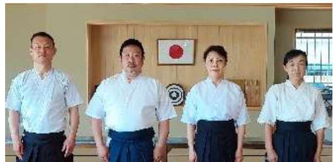
遠的 代表の皆さん