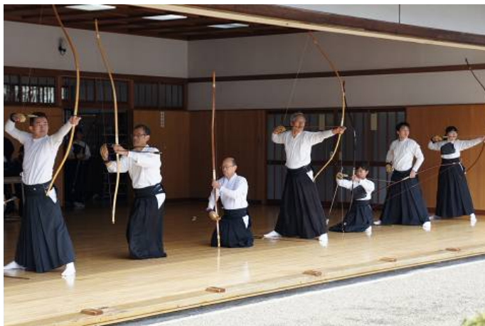
厳しい寒さの中、競技中の選手達