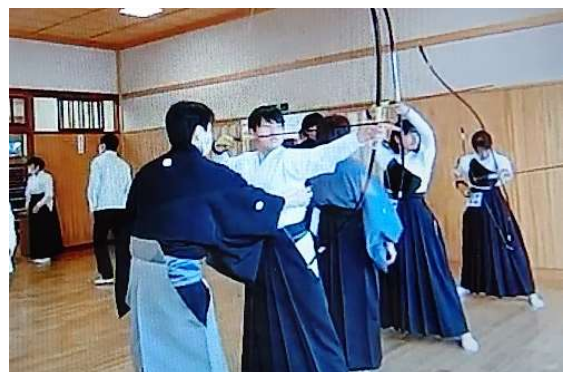
真剣な眼差しで指導を受ける

今回、参加した生徒たちは各校で他の部員たちもしっかりと伝達し、審査に向けて自信を持って練習に取り組んでいます。また、各一人ひとりの習熟度を把握されたご指導の積み重ねのおかげで、中体連弓道のレベルは技術面だけでなく、精神面も向上していると実感しています。今後も継続的なご指導をよろしく願いいたします。