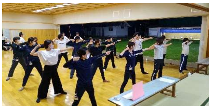
コロナ禍の弓道スクール

スクール修了者が土曜日に来やすい人なので、段位や経験の浅い人たちをこの時間帯にまとめるようにしています。ここに称号者が多くいるようにして、指導ができる体制にしています。