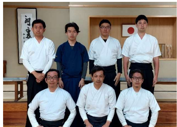
男子国体強化選手と監督(前列左)

◆ 奈良県スポーツ協会より 令和4年度に活躍された皆さんが表彰されました ◆ おめでとうございます