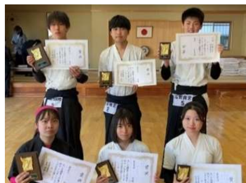
男女総合の部入賞者