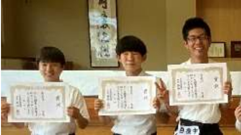
男子個人入賞者 (左から1位、2位、3位)