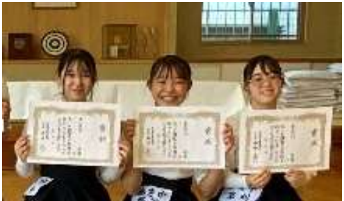
女子個人入賞者 (左から1位、2位、3位)