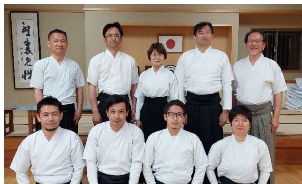
選手の皆さんと監督（後列右）