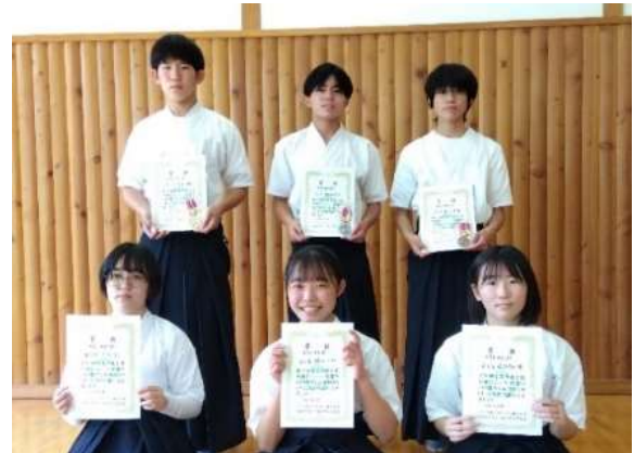
中学生の部 入賞者(左から1位、2位、3位)