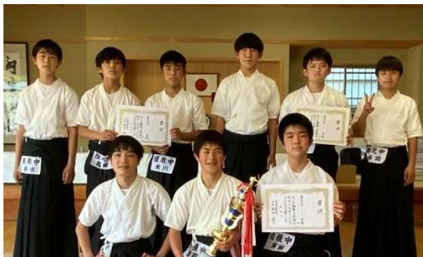
男子団体入賞者(前列1位、後列左から2位、3位)