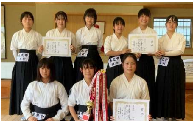
女子団体入賞者(前列1位、後列左から2位、3位) (中体連 中前芳一)